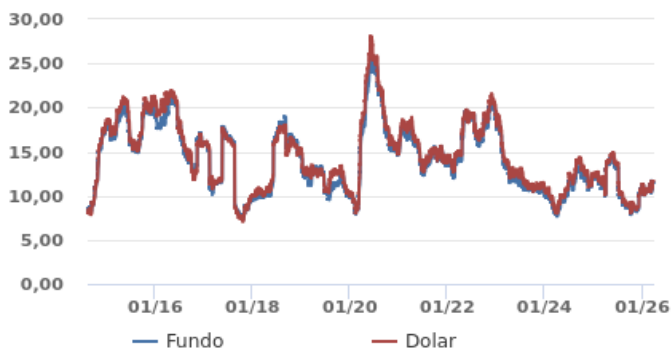
Volatilidade Anualizada (%): Janelas Móveis de 63 du