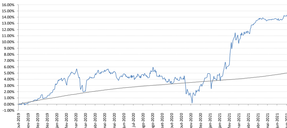
Gráfico de Rentabilidade - ENTERCAPITAL TURING FIC FIM