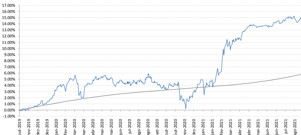
Gráfico de Rentabilidade - ENTERCAPITAL TURING FIC FIM